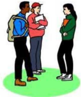
Calon Peserta SBMPTBR Th. 2019

Mendaftar SBMPTBR Tahun 2019 secara online melalui laman https://sbmptbr.unej.ac.id/ dengan memilih menu "Pendaftaran" untuk mendapatkan KAP dan PIN dengan mengisi data berupa Nama sesuai Ijazah, NISN, Jurusan di SMA/MA/SMK, Pilihan Kelompok Ujian, dan Tanggal Lahir.